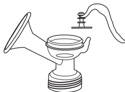
① Első stimuláló fázis, enyhe szívással