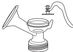
② Második stimuláló fázis, erősebb szívással